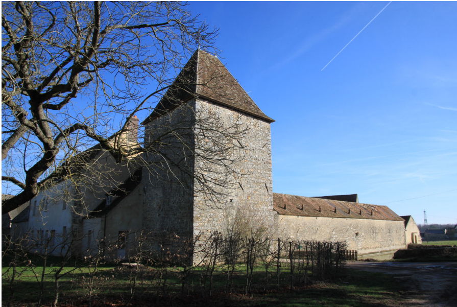
La ferme de Châteaupers