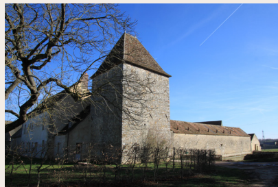
La ferme de Châteaupers

Petite anecdote : Rachel de Cocheilet, épouse de Sully, ministre d'Henri IV, fut une des illustres maitresses des lieux.